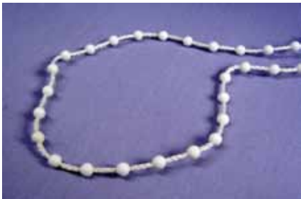
STANDARD - 4,5 x 12 mm

Do wykonania rolet mogą być stosowane dwa rodzaje łańcuszków: