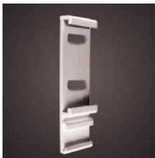
Wieszak przykręcany dzień/noc