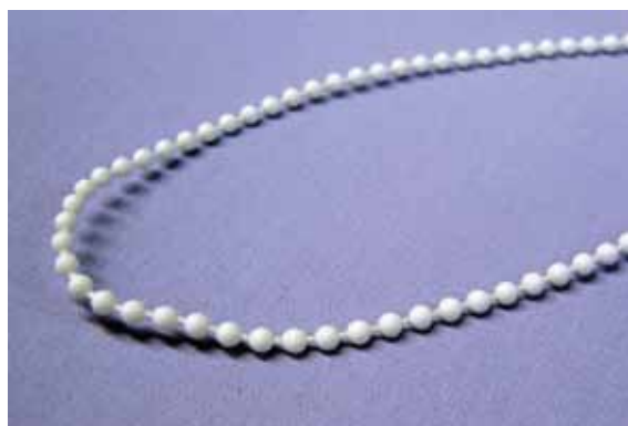
ISSO - 3,0 lub 3,2 mm x 6 mm Do mechanizmu MINI-T 3 (na zamówienie klienta)