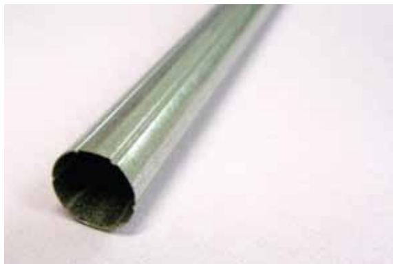
Rura stalowa o średnicy zewn 17 mm (standard)

Stosowane są dwa rodzaje rury nawojowej do rolet: