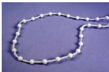
STANDARD - 4,5 x 12 mm

Do wykonania rolet mogą być stosowane dwa rodzaje łańcuszków: