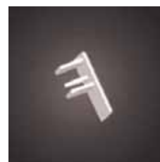
Zakończenie listwy dzień/noc