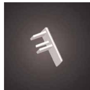
Zakończenie listwy dzień/noc