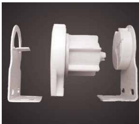
Mechanizm GRAND 36mm

Mechanizmy występują w kolorze białym oraz brązowym. Standardowo stosowany jest mechanizm biały.