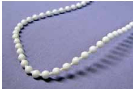
LUX - 4,5 x 6 mm