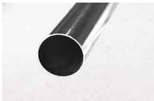
Rurka aluminiowa 25mm (na zamówienie klienta)