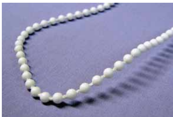
LUX - 4,5 x 6 mm Do mechanizmu MINI-T 4,5 (standard)

Do wykonania rolet mogą być stosowane dwa rodzaje łańcuszków: