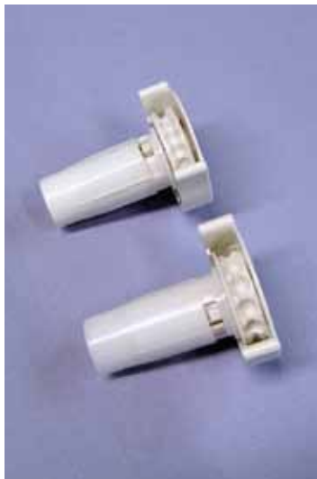
Kółko napędowe Mini-T 3 (u góry) Kółko napędowe Mini-T 4,5 (u dołu)

Mechanizm MINI-T występuje w 2 wariantach.