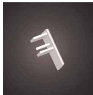
Zakończenie listwy dzień/noc