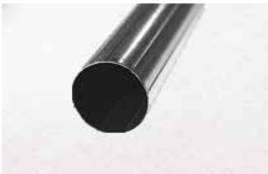
Rurka stalowa 25mm - STANDARD

Stosowane są dwa rodzaje rury nawojowej do rolet: