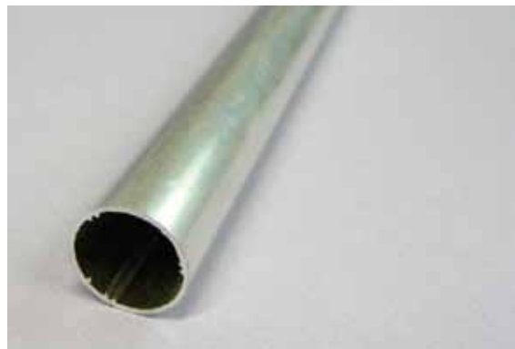
Rura aluminiowa o średnicy zewn 19 mm (na zamówienie klienta)