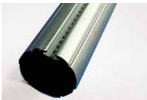
Rurka stalowa 36mm