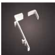
Wieszak bezinwazyjny dzień/noc

Są one regulowane i można je dostosować do różnej szerokości okien.