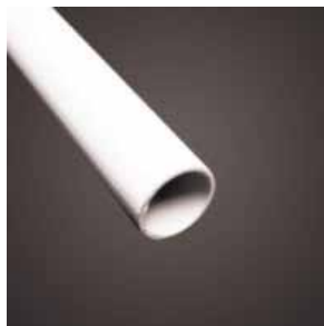
Rurka 14 mm

W roletach DZIEŃ NOC stosowany jest obciążnik aluminiowy DZIEŃ NOC składający się z rurki 14 mm, belki oraz zakończeń obciążnika - występują w kolorze białym.